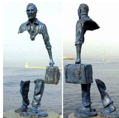
En flykting på väg över havet. Okänd konstnär

(som troligen kommer upp till höstträffen i Finnhamn!)