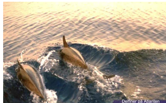
Delfiner på Atlanten

Lördag morgon hälsas vi av ett stort gäng glada delfiner – det är flera grupper om 10 - 15 stycken!