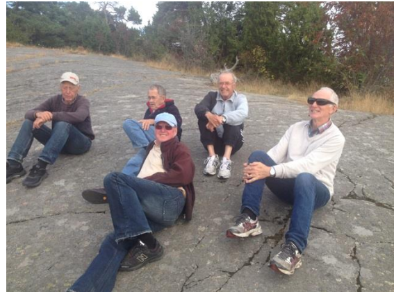
Samling på klippan