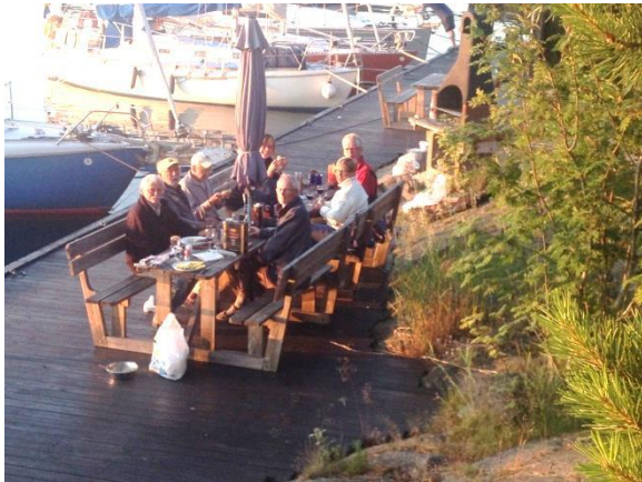
Ett hungrigt och glatt gäng!

hann vi aldrig notera hans namn men han kunde berätta - och gjorde det - om sina färder på de stora haven. Han hade mönstrat på som mattros på en skuta under mellankrigstiden och klarade sig oskadd igenom det andra stora kriget.