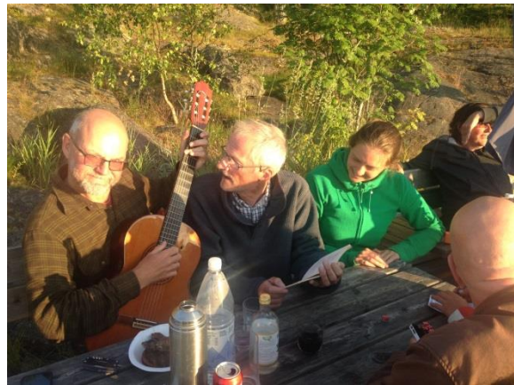
Musik blev det förstås!

Grillning, sång och musik, bastu och god mat - en lyckad sommarträff. Måhända vi planerar en sommarträff också nästa år?