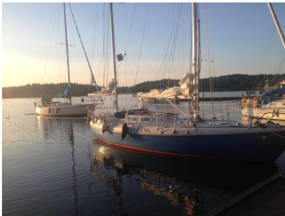
Vackra skutor.....och en vacker solnedgång!