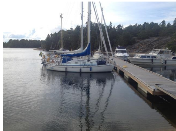
Staffans motorbåt på plats!