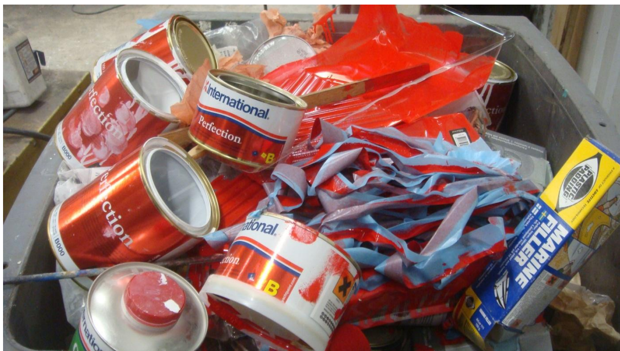
Drygt hundra slippapper, 1 kg spackel, en massa tejp och 5 + 5 liter färg gick åt

Avsändare: Laurinkostersällskapet c/o Bergman Sommarvindsvägen 14 133 32 Saltsjöbaden