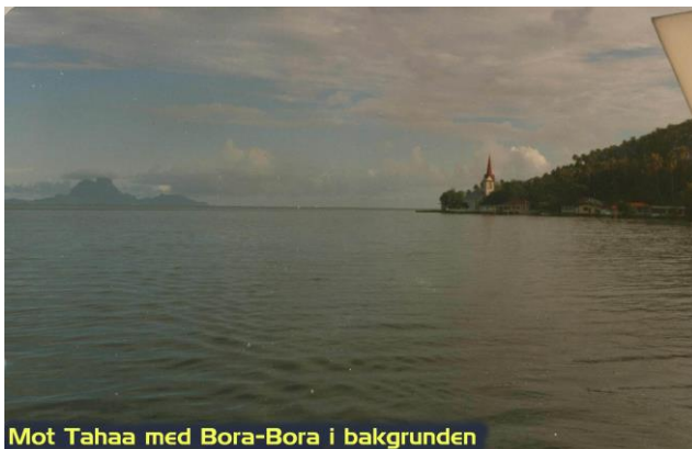
Mot Tahaa med Bora-Bora i bakgrunden

Som vanligt är när vi kommer till en ny plats, får vi strax besök av ungar från byn.